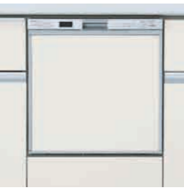
浅型タイプ（パネル材仕様）