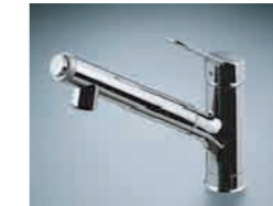
オールインワン浄水栓 AJタイプ