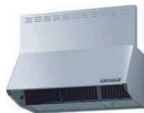
NBHシロッコファンタイプ シルバー